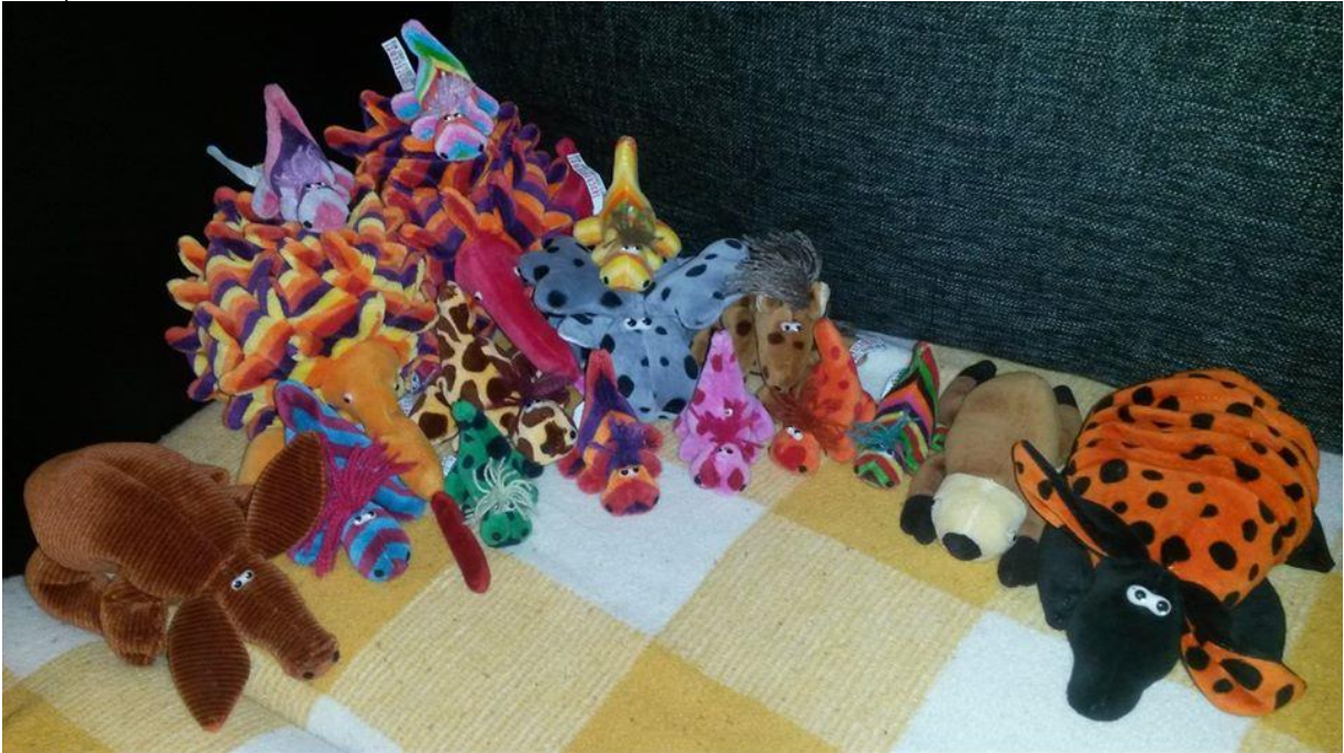
(Das ist die ganze Herde, nicht nur die Neuzugänge ;-))

Uuuund: Es war ja Spielmesse in Essen und, wie sollte es anders sein, wir Perlis bekamen Zuwachs. Unter anderem auch von einem Gürteltier (ein zweites ist zwecks artgerechter Pärchenhaltung per ebay adoptiert worden und hoffentlich schon ganz bald bei uns!).